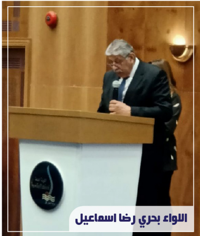
اللواء بحري رضا اسماعيل

كشف اللواء بحري رضا اسماعيل رئيس قطاع النقل البحري، عن فوز شركة الحلول المتكاملة « التابعة لوزارة النقل » بمشروع تطوير بنك معلومات النقل البحري التابع للقطاع وذلك بهدف تطوير الخدمات التي يتم تقديمها للسوق الملاحي من خلال البنك.