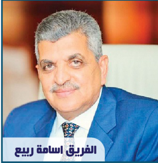
الفريق أسامة ربيع

وكشف ربيع عن ميعاد انتهاء أعمال تطوير القطاع الجنوبي بالقناة في يوليو 2023 ، ويشمل تعميق وتوسعة وإزوداج للكيلو 122 حتى الكيلو 162 ترقيم القناة مما يزيد القدرة الاستيعابية للسفن ويقلل التيارات المائية في هذه المنطقة، والتي تشرك فيها شركة التحدي الإماراتية. وقال إن قناة السويس دائماً تتخذ إجراءات غير تقليدية وخير دليل على ذلك إرشاد السفينة الإيطالية الموبوءة بنحو 62 حالة كورونا وتم إرشادها عن بعد من خلال قاطرتين وعبرت القناة في 10 ساعات ، وتم اعتبارها حالة إنسانية بالدرجة الأولى بعد رفض الموانئ المصرية دخولها.