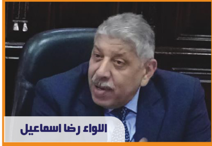
اللواء رضا إسماعيل

أكد اللواء رضا إسماعيل، رئيس قطاع النقل البحري، أن القطاع انتهى مؤخرًا من إعداد إستراتيجية لتعظيم سياحة اليخوت في مصر، والتي بدأت بإنشاء منصة إلكترونية يتعامل صاحب اليخت من خلالها أو من خلال وكيله الملاحي عبر نافذة واحدة لتفادي التعامل مع الجهات المختلفة ليكون لنا نصيب في البحر المتوسط من تلك السياحة.