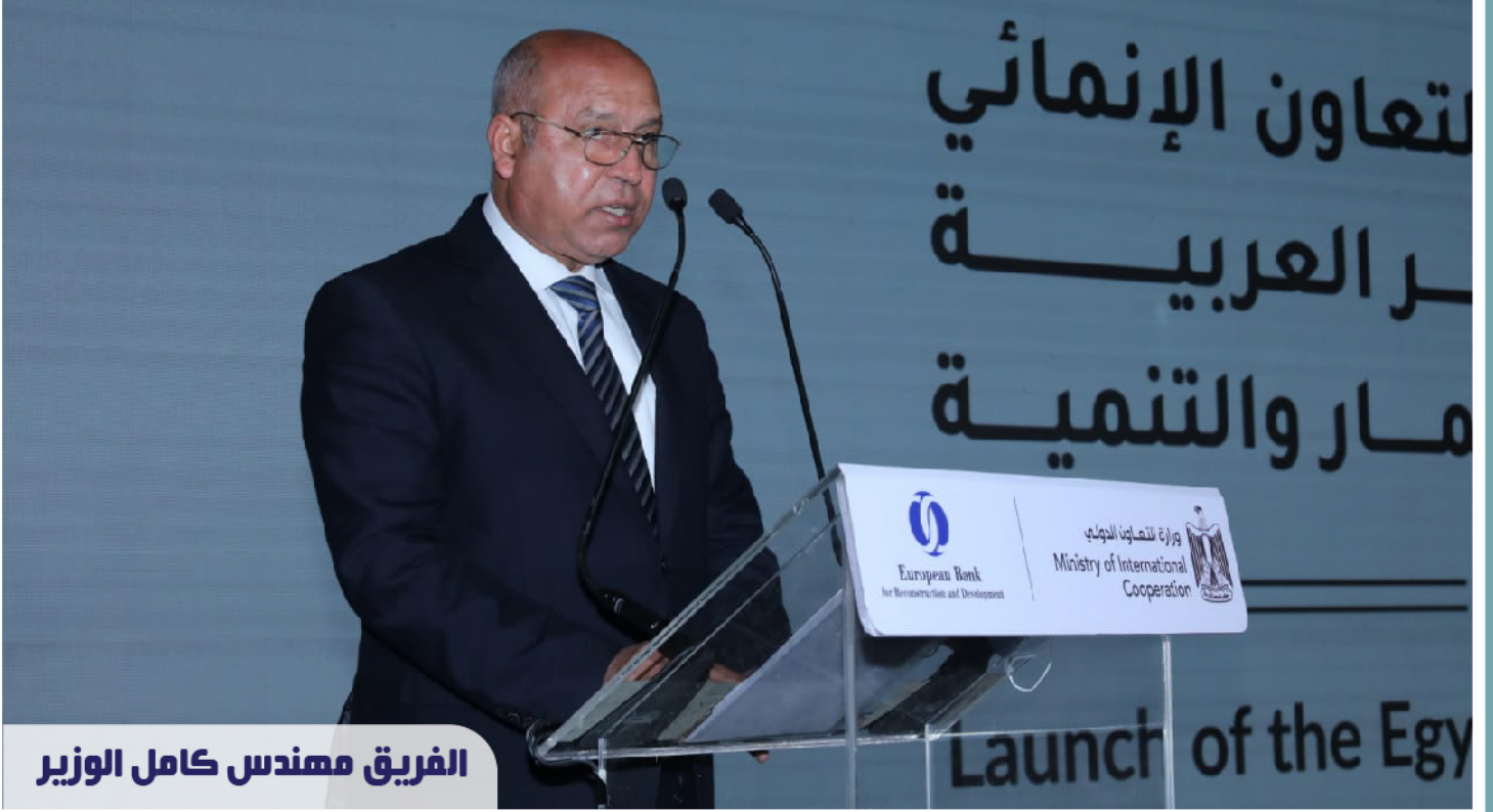
الفريق مهندس كامل الوزير