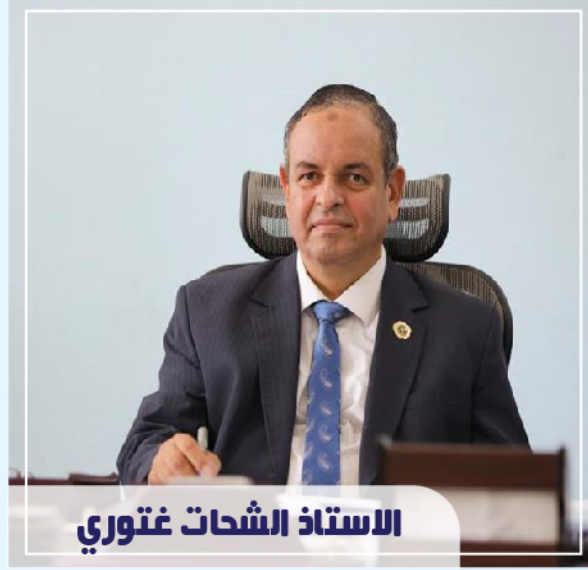
الاستاذ اشحات غنوري

أصدرت مصلحة الجمارك المصرية منشور تعليمات رقم 17 لسنة 2022 بالتنبيه على مديري المراكز اللوجيستية بالموانئ والمواقع الجمركية بالالتزام بمراعاة المتابعة اليومية لجميع البيانات الجمركية التي يتم توزيعها من خلال اللجان التخصصية. وأكدت التعليمات التي أصدرها رئيس مصلحة الجمارك الشحات غنوري ضرورة اتخاذ الإجراءات الكفيلة لنهوض البيانات الجمركية المتواجدة داخل نطاق كل مركز، وعلى مدير المركز متابعة البيانات المتواجد مشمولها في نطاق أعماله والتأكد من إنهاء إجراءاتها وله سحب هذه البيانات في حالات الضرورة القصوى. كما يتم قبول التظلمات الخاصة بالبيانات الجمركية الموزعة من خلال اللجان التخصصية بالمركز اللوجيستي المتواجد في نطاقه البضاعة ودراسته وإتخاذ ما يلزم بشأنه داخل المركز. ونص المنشور بأنه يأتي في إطار متابعة أداء العمل بالمراكز اللوجيستية التي تعمل بنظام النافذة الواحدة، وبمناسبة بدء تفعيل اللجان التخصصية على مستوى هذه المراكز.