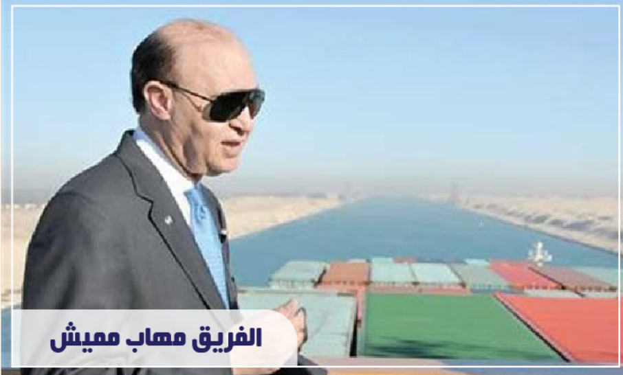
الفريق مههاب مميشتل

وأضاف الفريق مههاب مميشتل أن مصر تعمل على تطوير قناة السويس بشكل مستمر، معتبرا أن القناة تعد أكثر ممر ملاحي آمن في العالم. وتابع "مميشتل" أن هيئة القناة تغلبت على جائحة كورونا، ومعدات عبور السفن في