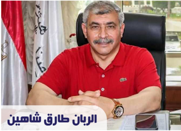
الربان طارق شاهين

كشف الربان طارق شاهين رئيس هيئة ميناء الإسكندرية عن أن الهيئة تمكنت من تحقيق تزايد في معدلات التداول خلال شهر يناير من العام الجاري بالمقارنة مع شهر يناير من العام السابق إذ شهدت حركة السفن زيادة بنسبة 5%.