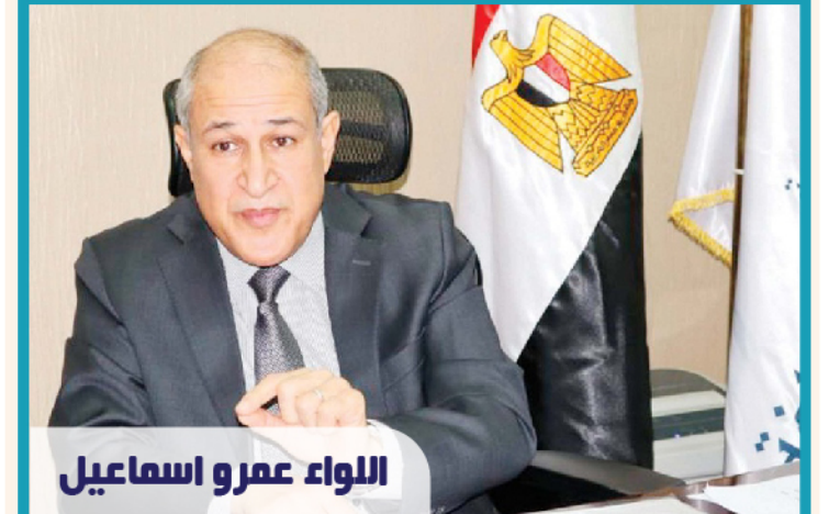
اللواء عمرو إسماعيل

كشف اللواء عمرو إسماعيل، رئيس هيئة الموانئ البرية والجافة، أنها تلقت مؤخرًا عرضًا من تحالف «إيطالي - مصري» لتنفيذ وإدارة وتشغيل ميناء برج العرب على مساحة 90 فدانًا، مشيرًا إلى أن فريقا يعكف على دراسته، لتحديد مدى إمكانية طرح المشروع ودخول تحالفات أخرى لتأهيلها.